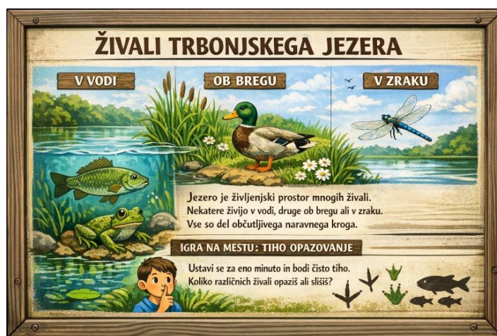
Slika 12: Živali

Koliko različnih živali opaziš ali slišiš?