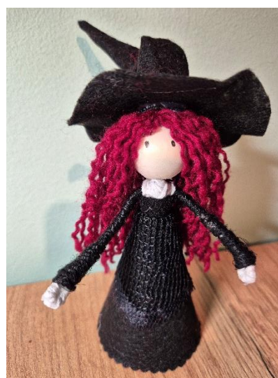
Slika 15: Čarovnica Jolanda