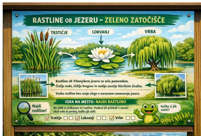
Slika 11: Rastline ob jezeru