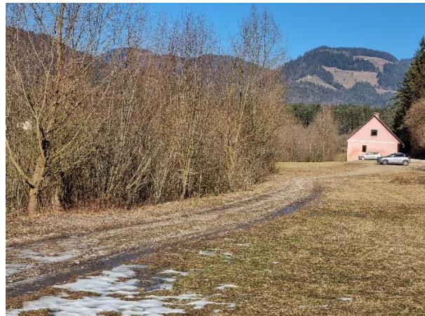
Slika 4, 3: Možnosti ureditve okolice jezera