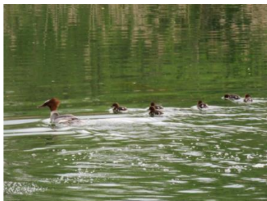
Slika 6: Raca žagarica z mladički