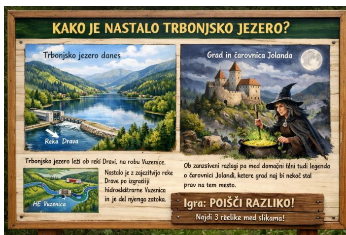
Slika 10: Nastanek jezera

Na ilustraciji sta prikazana dva prizora: resnični nastanek jezera in legendarni. Obiskovalci poiščejo 3 razlike med njima.