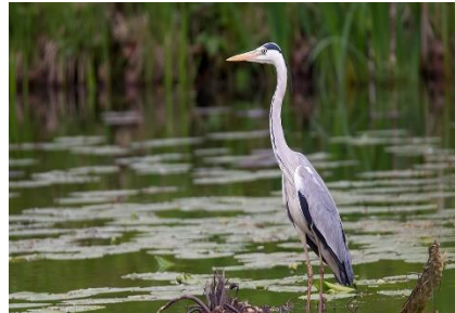
Slika 7: Siva čaplja