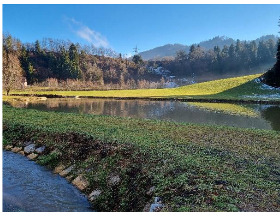
Slika 3: Okolica Trbonskega jezera