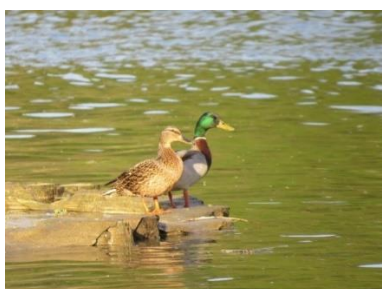
Slika 5: Raca mlakarice

Ptice pri nas večinoma gnezdijo od marca do junija, najbolj aktivne pa so zjutraj in zvečer. Opazujemo jih lahko vse leto, najlažje pa je v času, ko so mirne in manj plašne. Pri opazovanju je pomembno, da smo tihi, nosimo neopazna oblačila in ptic ne motimo. Vrste ptic prepoznamo po obliki, velikosti, barvi in vedenju.