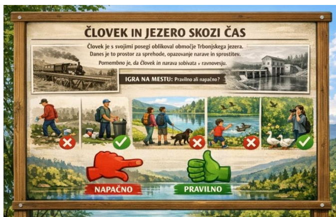
Slika 13: Človek in jezero

Na tabli so prikazane slike različnih dejanj (smeti v naravi, sprehod, vznemirjanje živali). Obiskovalci s prstom pokažejo, katera ravnanja so primerna.