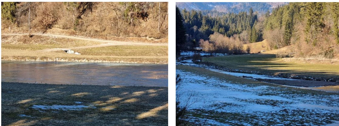
Slika 8, 9: Naravni wellnes ob jezeru