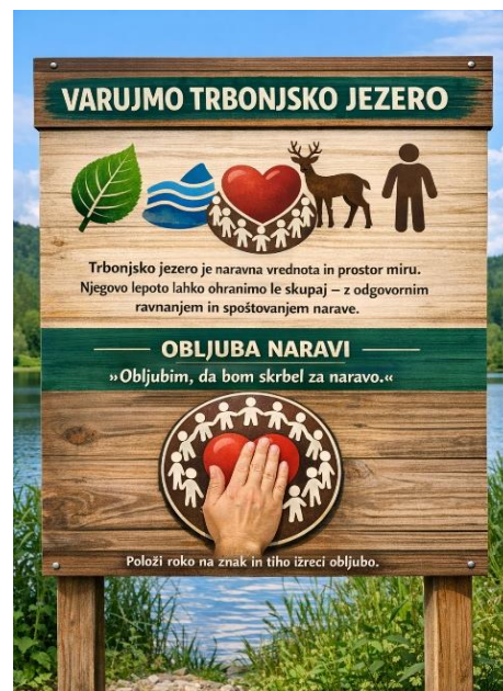
Slika 14: Varovanje jezera

Obiskovalci lahko simbolično položijo roko na znak in tiho izrečejo obljubo.